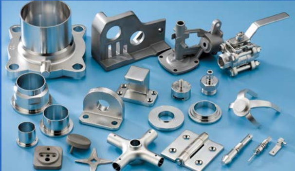
炭素鋼、合金鋼、ステンレス鋼 を使用したロストワックス

機械加工が困難な小さく複雑な形状の部品の製造や、機械加工の省略化・部品の複合化によるコストダウンを実現しています。